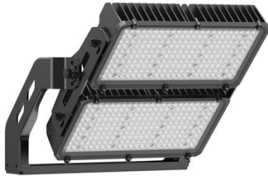
התמונה להמחשה בלבד!