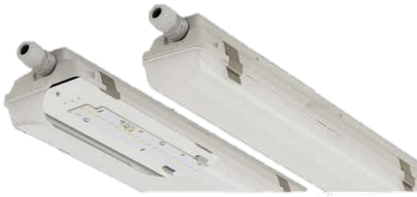
התמונה להמחשה בלבד!