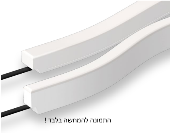
התמונה להמחשה בלבד!