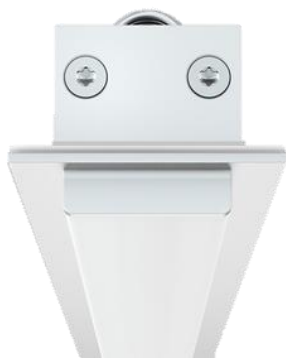
התמונה להמחשה בלבד!